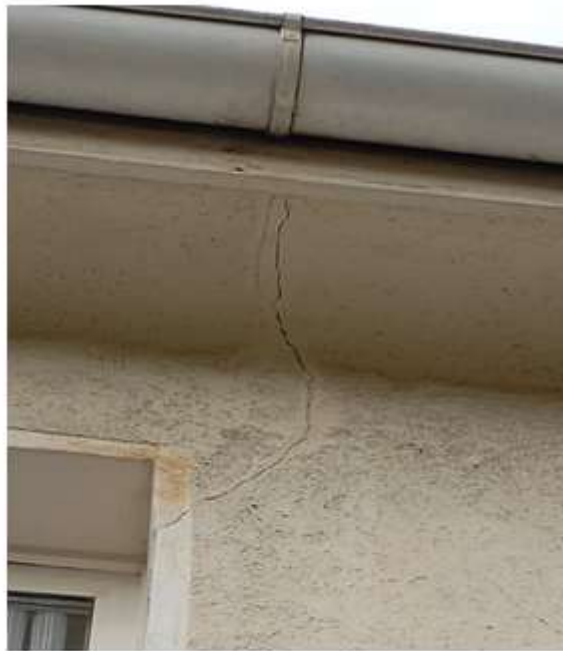
Bild1: Mauerwerksriss bis zur Traufbohle

(Schlagregenereignisse, verdreckte Dachrinnen, verstopfte Fallrohre, Risse und Mikrorisse)