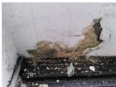
Bild2: Feuchteschäden am Balkonanschluss

Mangelnder Schutz vor Regeneintritt führt oft zu Feuchtigkeitsschäden in Gebäuden. Schlagregenereignisse können Wasser in Risse und Mikrorisse des Mauerwerks drücken, was zu Durchfeuchtungen führt. Sollte dieses Wasser dann hinter die „wasserundurchlässige Dämmung“, z.B. aus Styropor, laufen, kann es nur noch in den Gebäudeinnenbereich entweichen. Verdreckte Dachrinnen und Fallrohre verhindern den geregelten Abfluss von Regenwasser, sodass es an den Fassaden herunterläuft. Zwar sollte eine physikalisch intakte Isolierung der Kelleraußenwand dem eine Zeit standhalten, kritisch wird es jedoch, wenn das Regenwasser hinter die Isolierung läuft. In diesem Fall ist eine Durchfeuchtung der Kellerwand nahezu zwangsläufig. Die Feuchtstellen sind dann im Keller oft wenige Zentimeter über der Kellersohle gut zu erkennen vorausgesetzt, dort steht kein Schrank.